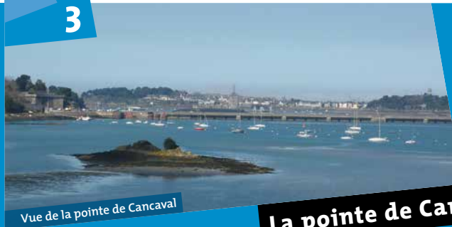
Vue de la pointe de Cancaval