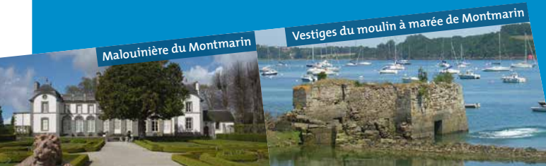
Malouinière du Montmarin

Construit en 1807, il est un des nombreux moulins à marée qui s'échelonnaient autrefois sur les deux rives de La Rance entre Saint-Malo et Dinan. Propriété privée, il a été restauré en 1962. Cette belle demeure abrite aujourd'hui des chambres d'hôtes.