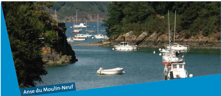
Anse du Moulin-Neuf