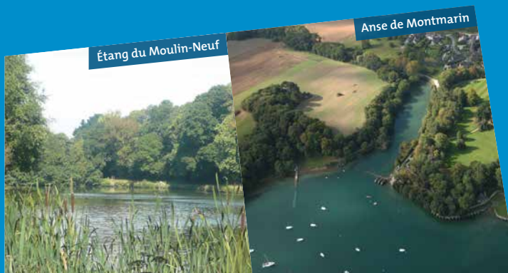
Étang du Moulin-Neuf