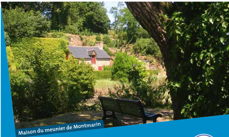
Maison du meunier de Montmarin