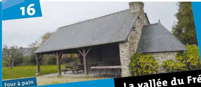
Four à pain