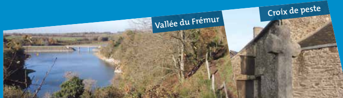
Vallée du Frémur