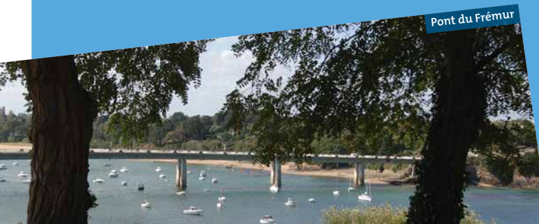
Pont du Frémur

Reliant Lancieux à Saint-Briac-sur-Mer, il a été construit en 1980 pour remplacer un pont datant de 1929 qui permettait le passage du tramway ainsi que les convois de marchandise de Plancoët à Lancieux vers Saint-Briac sur Mer et Dinard. Avant 1929, on devait traverser le Frémur à pied à marée basse ou sur une embarcation à marée haute.