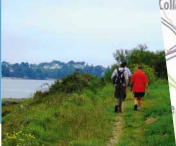
Rive droite du Frémur