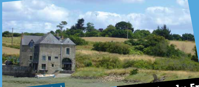
Moulin de Roche-Good