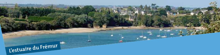
L'estuaire du Frémur