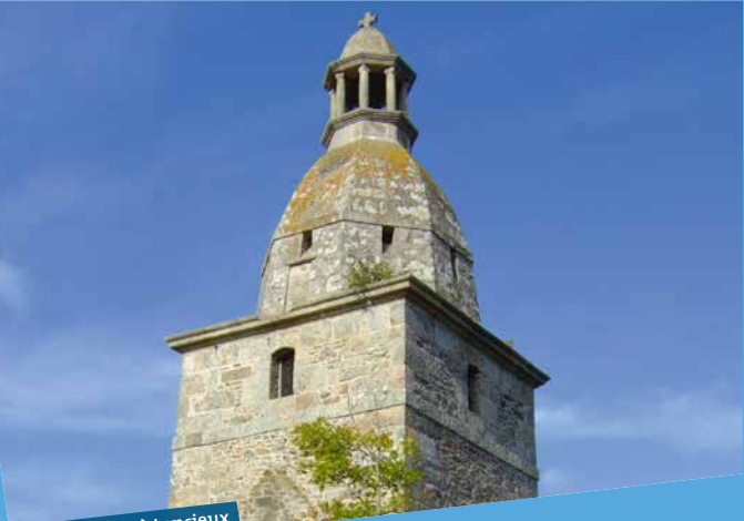
Vieux clocher à Lancieux