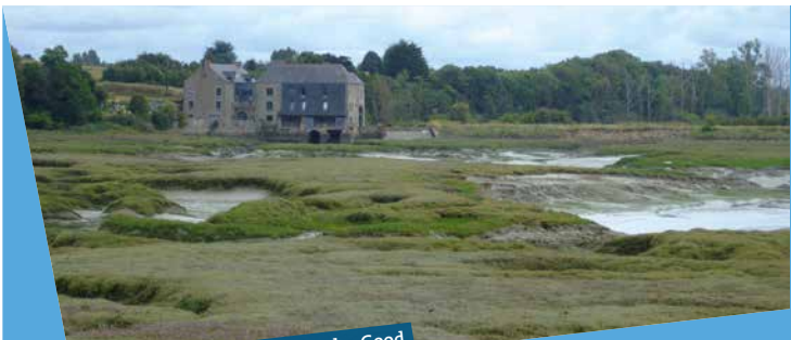
Ancien moulin à marée de Roche-Good