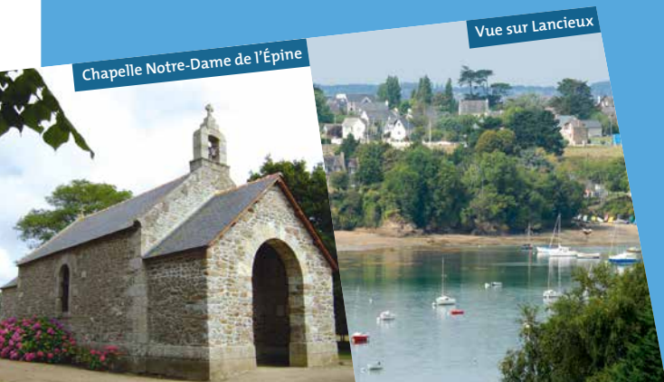
Chapelle Notre-Dame de l'Épine

On observe deux anciens moulins à vent privés sur le circuit: le moulin de Bellevue sur le grand circuit et le moulin de La Marche sur le petit circuit.