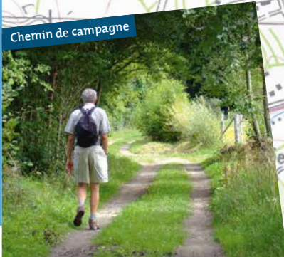
Chemin de campagne